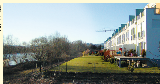
Hochwasserangepasste Bauweise mit erhöhtem Erdgeschoss