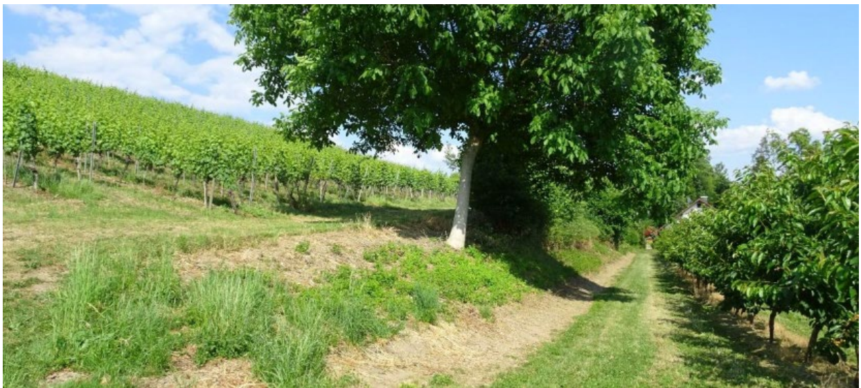
Blick von Westen auf die Böschung / nördlich Weinanbau südlich Kirschplantage.

Reptilien/Amphibien. In der artenschutzrechtlichen Relevanzbegehung wurde die südexponierte bromberbewachsene Böschung auf Flurst.Nr. 7542 und 7513 sowie die nördlich angrenzenden Bereiche (Flst.Nr. 7511, 7512, 7513) bereits als potenzielles Habitat für die strenggeschützte Zauneidechse benannt. Dort sind lichte Bereiche sowie Totholz- und Steinhaufen vorhanden