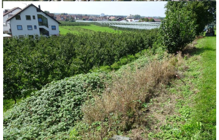
Blick vom Nordrand des Plangebiets in Richtung Südwesten (Brombeergestrüpp, Kirschplantage Bebauung am Moosweg)