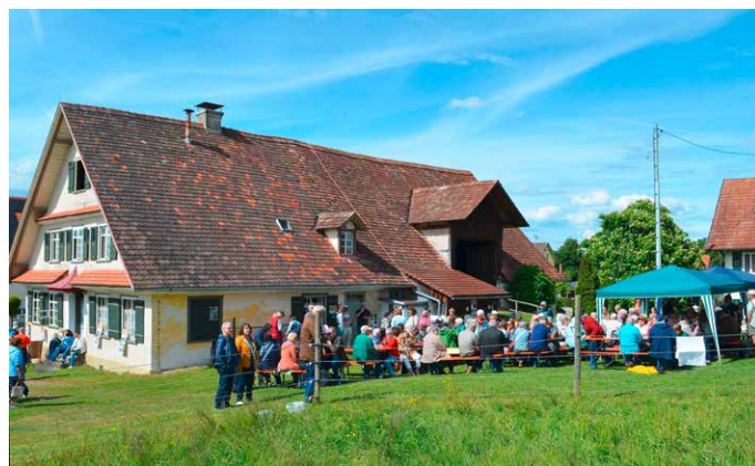
Saisonauftritt auf der Hofanlage Milz bei herrlichem Wetter und zahlreichen Besuchern