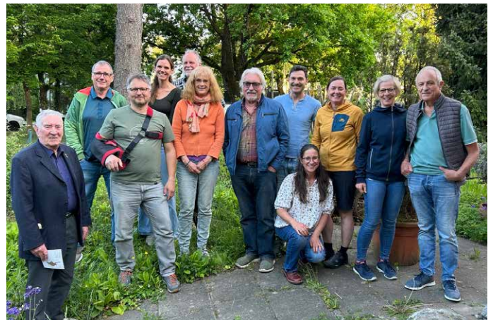
Die Teilnehmenden der diesjährigen Mitgliederversammlung des Vereins

Am 8. Mai 2026 fand die jährliche Mitgliederversammlung des Fördervereins Kinderhilfe Birma e.V. im Sportrestaurant in Kressbronn statt. Der Verein setzt sich seit vielen Jahren mit viel Engagement für Kinder in Myanmar ein und blickt auf ein ereignisreiches Jahr mit vielen Herausforderungen durch die dramatische politische Lage vor Ort zurück. Auf der Tagesordnung stand neben dem Rückblick auf die Vereinsaktivitäten auch die Neuwahl des Vorstands.