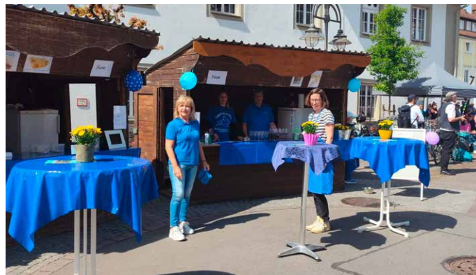
Crêpe- und Getränke-Stand der Tierfreunde Bodenseekreis e.V.

Am Sonntag 26. April könnt ihr euch von 11:00 – 18:00 Uhr an unserem Stand beim HGV-Fest „Wir sind Langenargen“ über unseren Tierschutzverein „Tierfreunde Bodenseekreis e.V.“ und unser Tierheim informieren. Auch eine Übersicht aller Tiere, die aktuell ein Zuhause suchen, haben wir vor Ort dabei.