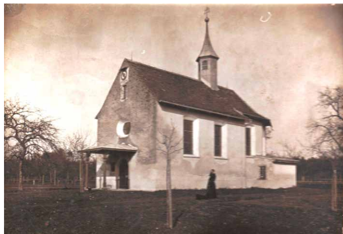
Die Josefscapelle in Ettenried-Tunau um das Jahr 1900

den Wanderer weit weg. Und doch haben Menschen seit alters gespürt: hier ist ein besonderer Platz; hier in dieser Einsamkeit, in dieser Ruhe bin ich ganz nahe bei mir. Der See, die Berge, die Bäume, das Ried geben mir Kraft, machen mich stark.