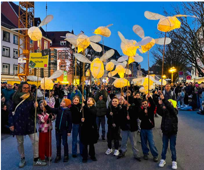
Stolz zeigen die Kinder der Klasse 2b der Nonnenbachschule ihre leuchtenden Glühwürmchen beim Umzug des Lichterfest Ravensburg.

Kreativität, Teamarbeit und eine große Portion Vorfreude: Die Klasse 2b der Nonnenbachschule hat in den vergangenen Wochen fleißig für das Lichterfest Ravensburg gearbeitet. In vier Workshoptagen, jeweils zwei Stunden lang, gestalteten die Schülerinnen und Schüler ihre eigenen leuchtenden Glühwürmchen für den großen Umzug durch die Stadt.