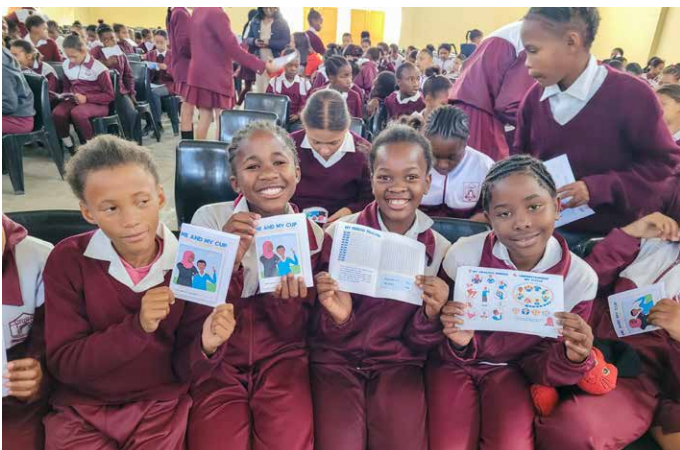
Das Foto zeigt die Mädchen nach dem Workshop mit ihren erhaltenen Unterlagen

Der Verein Namibiakids e. V. hielt seine diesjährige Hauptversammlung am 27. Februar 2026 virtuell ab. Die 87 Mitglieder erhielten im Vorfeld per email die Einladung inkl. eines Links für das Meeting.