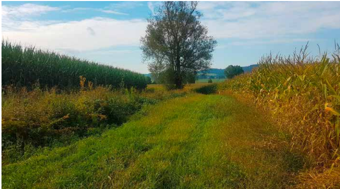
Gewässerrandstreifen an einer Ackerfläche.

Zwischen Gewässern und Ackerland muss ein Schutzstreifen von mindestens fünf Metern eingehalten werden. Darauf weist das Amt für Wasser und Bodenschutz die Landwirte im Bodenseekreis hin. Der Grünstreifen schützt Seen, Flüsse, Bäche und Gräben vor Schadstoffen wie Pestiziden und Düngemitteln und ist außerdem ein wertvoller Lebensraum für viele Pflanzen- und Tierarten. Verstöße können behördliche Maßnahmen und Bußgelder bedeuten.