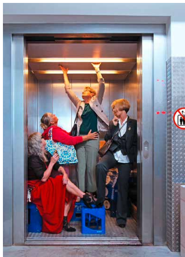
Vier Frauen, ein Fahrstuhl und jede Menge Zündstoff

Mitten in einem Einkaufszentrum treffen sie aufeinander: Amanda, die lebenslustige Frohnatur; Cindy, die selbstbewusste Genießerin; Karoline, die ehrgeizige Journalistin und Johanna, das liebenswerte Chaos auf zwei Beinen.