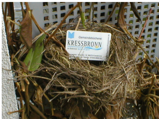
Vogelnest an der Außenfassade der Bücherei. Auch die Tierwelt findet gefallen an unseren Medien!