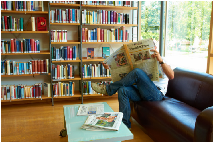
Zeitungsleser im Lese-Café