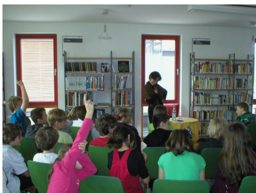
Gräfin zu Waldburg-Zeil erzählt Märchen