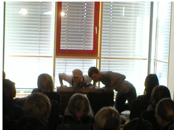
Esslinger Landesbühne spielt für Schülerinnen