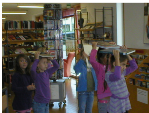
Spiel & Spaß mit Büchern für Schüler