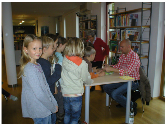
Autorenlesung für Schulklassen