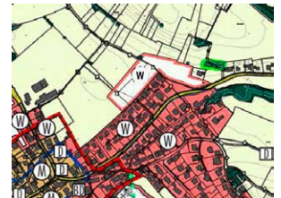
5. Änderung Bereich Moos I

Änderungsbereich „Bachtobel“ (Flächenkompensation) Herausnahme von ca. 1,35 der geplanten Wohnbaufläche aus dem Flächennutzungsplan. Eine Fläche von 0,4 ha bleibt östlich der Tettmanger Straße als geplante Wohnbaufläche im Flächennutzungsplan erhalten.