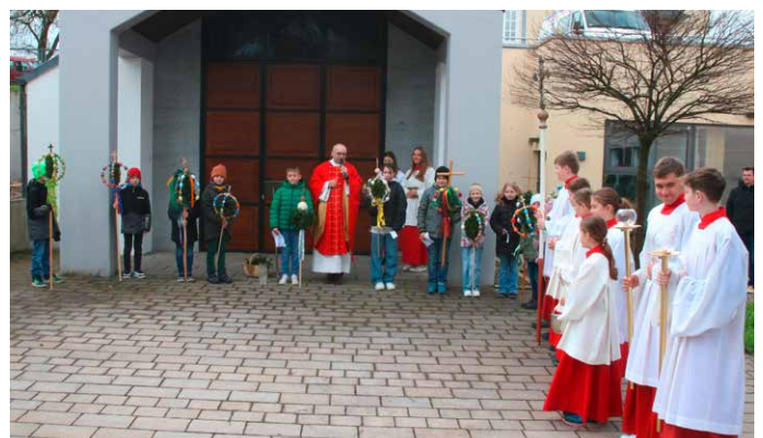
Palmsonntag in Gattnau