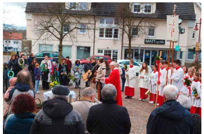
Palmsonntag in Kressbronn

ist es uns ein Bedürfnis, allen herzlich zu danken, die sich beim Osterschmuck in unseren Kirchen und bei der Gestaltung der Gottesdienste engagiert haben. Es war für uns eine Freude, mit Ihnen zu feiern! Das Pastoralteam