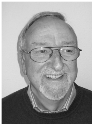
Der ehemalige Rektor der Grund- und Hauptschule stirbt mit 78 Jahren