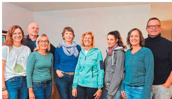
Die Vorstandschaft freut sich auf die Jubiläumsfeier am 18. November in der Festhalle

rigkeiten stellte die Gemeinde 1953 dem Verein bis zum Bau der neuen Sporthalle im Jahre 1962, das alte Feuerwehrhaus als Übungsraum zur Verfügung. Seit dieser Zeit hat sich auch die Mitgliederzahl kontinuierlich nach oben entwickelt.