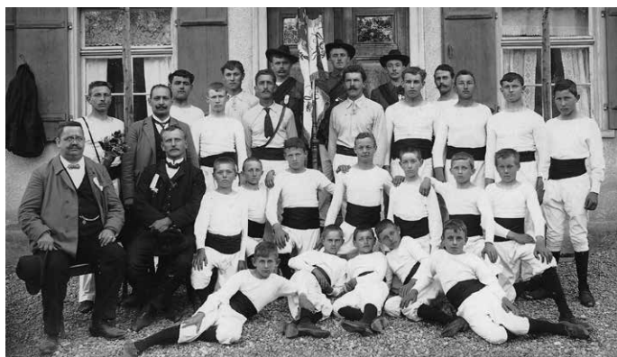
Der Turnverein Kressbronn wurde 1898 gegründet. Auf dem Bild von 1908 ist die Fahnenweihe zum 10-jährigen Jubiläum zu sehen.