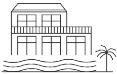
PENSION AM BODENSEE