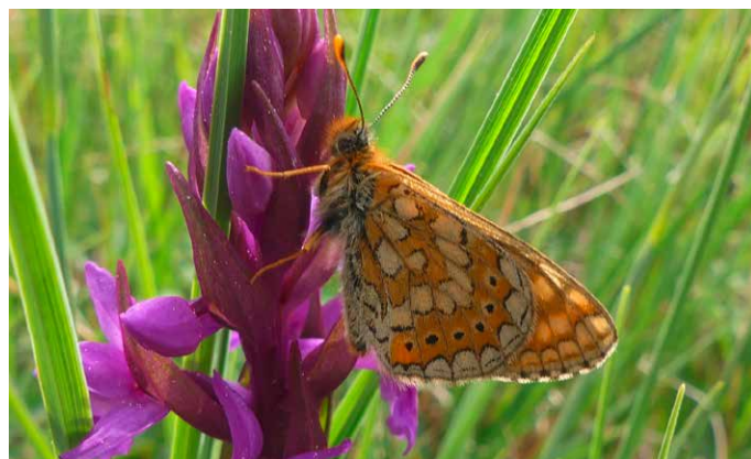
Die FFH-Art Goldener Scheckenfalter kommt noch am Degersee vor, weil sie hier ihre Raupenfutterpflanze Teufelsabbiss findet.

Der Degersee ist Teil des nach der EU-Fauna-Flora-Habitat-Richtlinie geschützten FFH-Gebiets „Argen und Feuchtgebiete bei Neukirch und Langnau“ und weist noch eine besondere Artenvielfalt auf. Besonders am Nordostufer des Sees gibt es