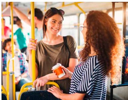
Noch bis 18. Juni 2023 können Bürgerinnen und Bürger an der Umfrage teilnehmen.

und mit ihren Angaben zum eigenen Fahrverhalten, der Pünktlichkeit von Bus und Bahn sowie möglichen Verbesserungsvorschlägen wichtige Infos für den Entwurf des neuen Nahverkehrsplans des Landkreises geliefert. Die Beantwortung der Fragen auf dem Beteiligungsportal „Sags doch & Mach mit“ dauert etwa fünf bis zehn Minuten: www.sags-doch.de/nahverkehr