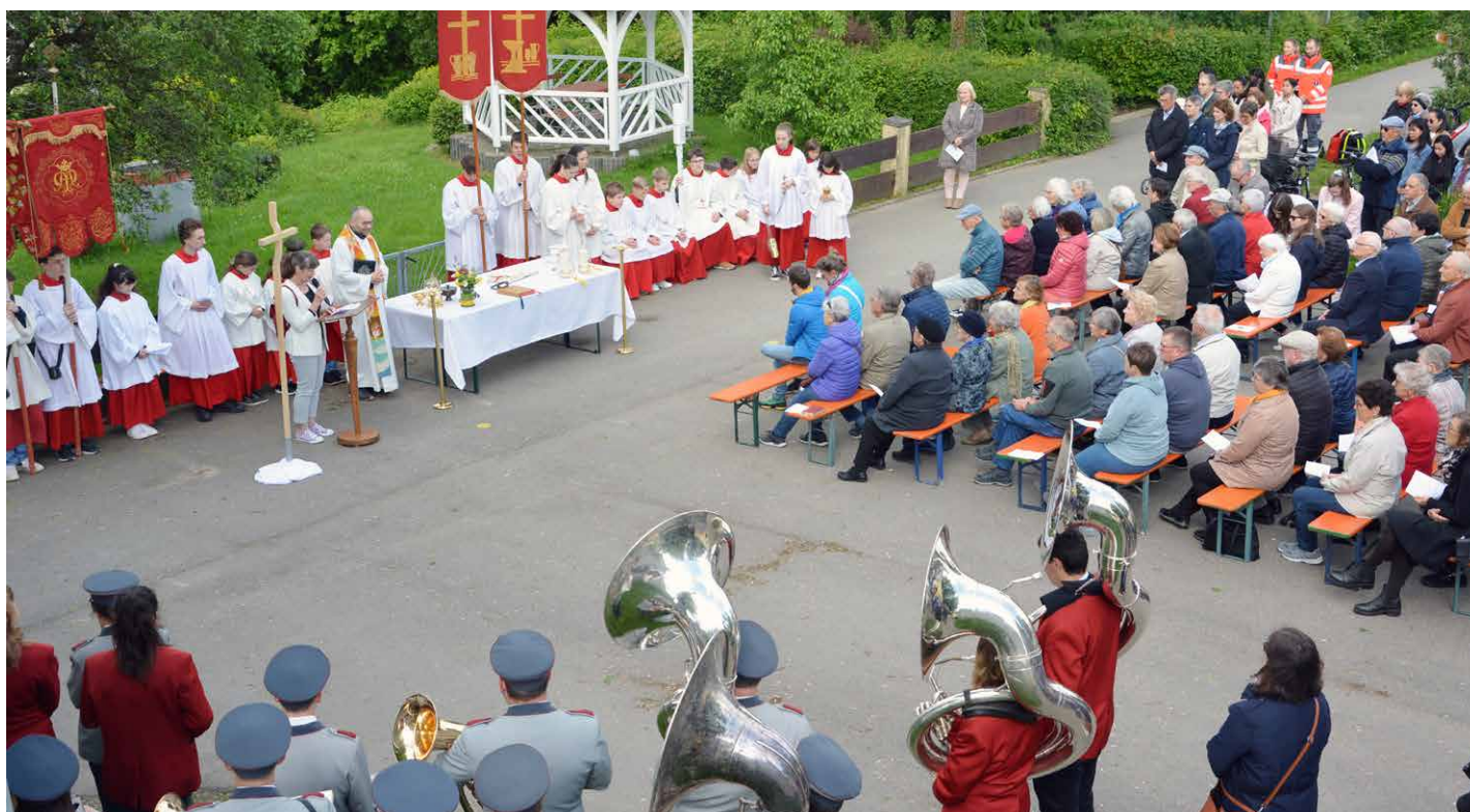
Wohlauf mit hellem Singen, hinaus ins grüne Feld...