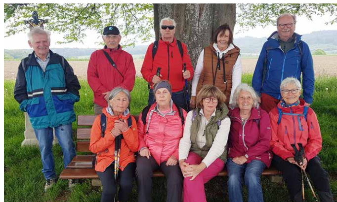
Wandergruppe des Ortsverbandes Kressbronn des BUND

Die Vereinbarung mit dem Wettergott für Samstag, 13. Mai hält: trübes aber trockenes Wetter. Dank einer zuverlässigen Zugverbindung starten wir um 10.30 ab dem Bahnhof Überlingen Therme. Unser Weg führt uns zunächst entlang des Sees durch den Uferpark des ehemaligen Gartenschaugeländes. Dort beobachten wir eine Reihe von Seevögeln in ihren Frühjahresaktivitäten. Auf Höhe der bemerkenswerten Sylvesterkapelle