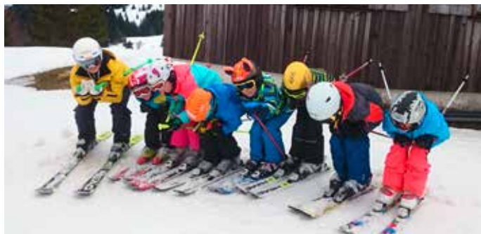
Die Schusshocke wird beim Skikurs natürlich auch geübt

Der Skiclub Kressbronn bietet einen Wochenendskikurs für Kinder-Anfänger und Fortgeschrittene an. Am 25. und 26. Februar finden die Kurse in Damüls statt.