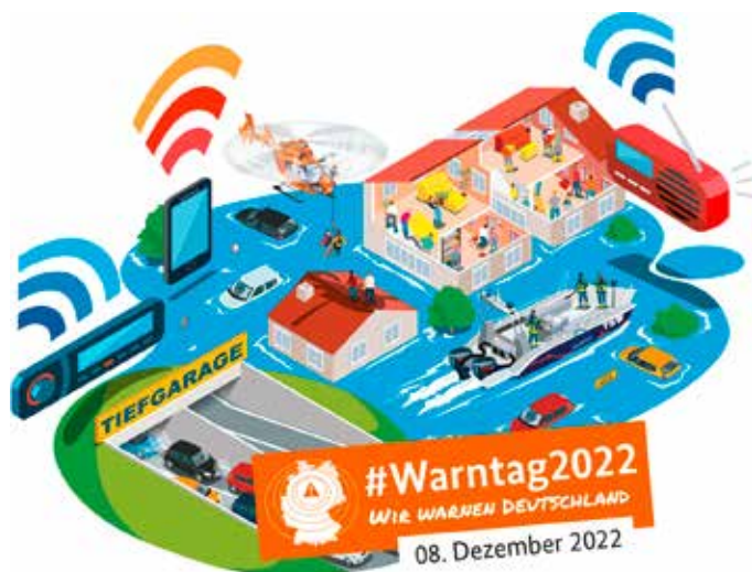
Am 8. Dezember 2022 ist Warntag in Deutschland (Grafik: Bundesamt für Bevölkerungsschutz und Katastrophenhilfe)

Eine gute Wahl ist aber auch die Behörden-Warn-App NINA. Die Warn-App gibt es kostenlos und werbefrei im App-/Play-