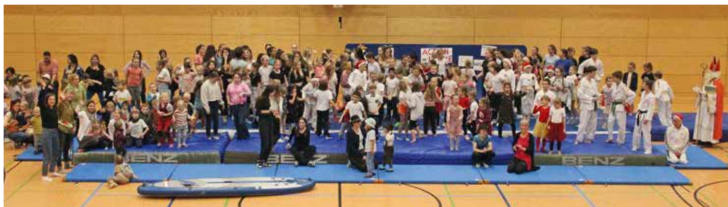
Über 250 Kinder aus den TV-Abteilungen durften sich nach längerer Corona-Pause wieder über das traditionelle Nikolausturnen des Turnvereins Kressbronn freuen. Näheres auf den Seiten 18 bis 19.