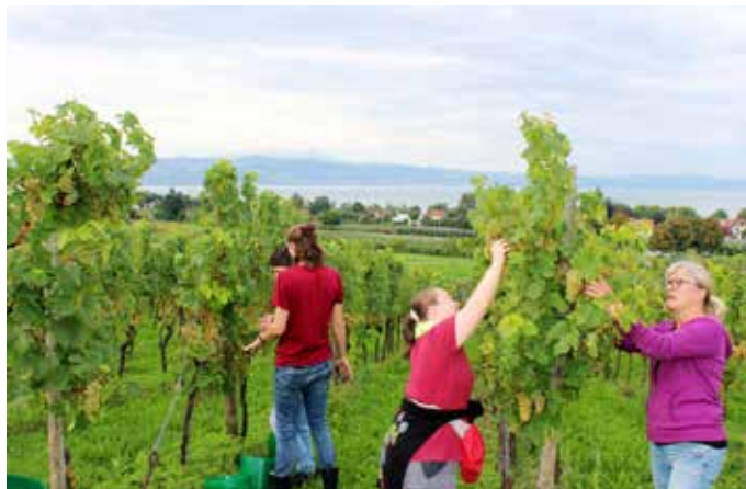
Fleißige Helfer bei der Weinlese auf dem Weinberg der Stiftung Liebenau bei Kressbronn.

Früher als in den anderen Jahren hat bereits jetzt die Weinlese am Bodensee begonnen. Das Besondere an dieser Lese auf dem Weinberg der Stiftung Liebenau ist, dass Menschen mit Behinderungen, zusammen mit den Fachkräften aus dem Berufsbildungsbereich (BBB), die Trauben von Hand lesen.