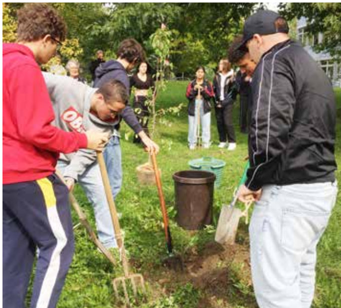
Schülerinnen und Schüler der Klasse 10 des Bildungszentrums pflanzen den Jubiläums-Birnbaum

Weil im Herbst die beste Jahreszeit zum Pflanzen eines Baumes ist, wurde der Birnbaum, den das Bildungszentrum Parkschule anlässlich des 50-jährigen Jubiläums von Bürgermeister Daniel Enzensperger erhalten hatte, nun gesetzt. Schülerinnen und Schüler der Klasse 10 schwingen den Pickel, um die harte Erde