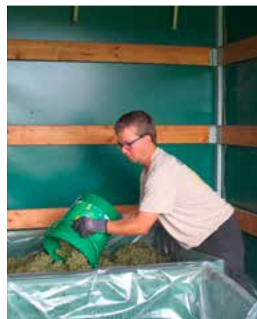
Nach kürzester Zeit ist die erste Großkiste mit Trauben bereits gefüllt.

Morgens um 9 Uhr versammeln sich rund 25 Menschen mit Einschränkungen, ausgestattet mit Rebscheren und Eimern, um mit der Lese zu beginnen. Das Wetter ist angenehm, der Ausblick über den Bodensee herrlich. Die jungen Leute vom Berufsbildungsbereich werden bei der Lese von Kolleginnen und Kollegen aus dem Garten- und Landschaftsbau, aus der Gärtnerei und dem Liebenauer Landleben unterstützt. Einen guten halben Hektar gilt es heute abzurnten - da zählt jede helfende Hand. Schnell füllen sich die Eimer und bald schon ist die erste Großkiste gefüllt.