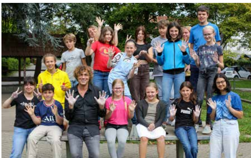
Die Teilnehmer des Kressbronner Kunstcampus mit Christof Söller zeigen ihre mit Ton verschmierten Hände

Die Werke Söllers irritieren, faszinieren. Während man Keramik in erster Linie mit Gebrauchskunst verbindet, sagt Söller: „Nach theoretischen Aufgaben und Installationen hatte ich das große Bedürfnis, etwas mit den Händen zu machen, dem Ton etwas zu entlocken. Ich benutze das Material, um bildhaue-