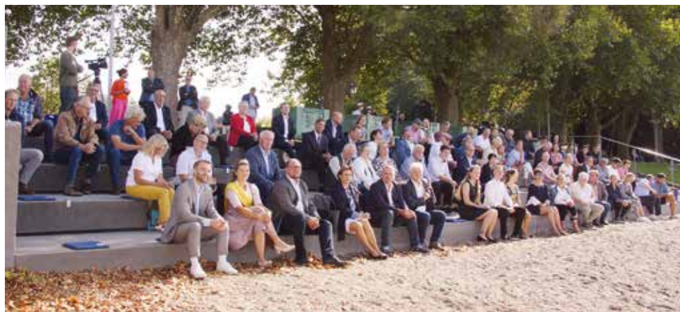
Mit direktem Blick auf den Bodensee verfolgten die knapp 100 anwesenden Gäste die Veranstaltung im Seegarten Kressbronn am Bodensee