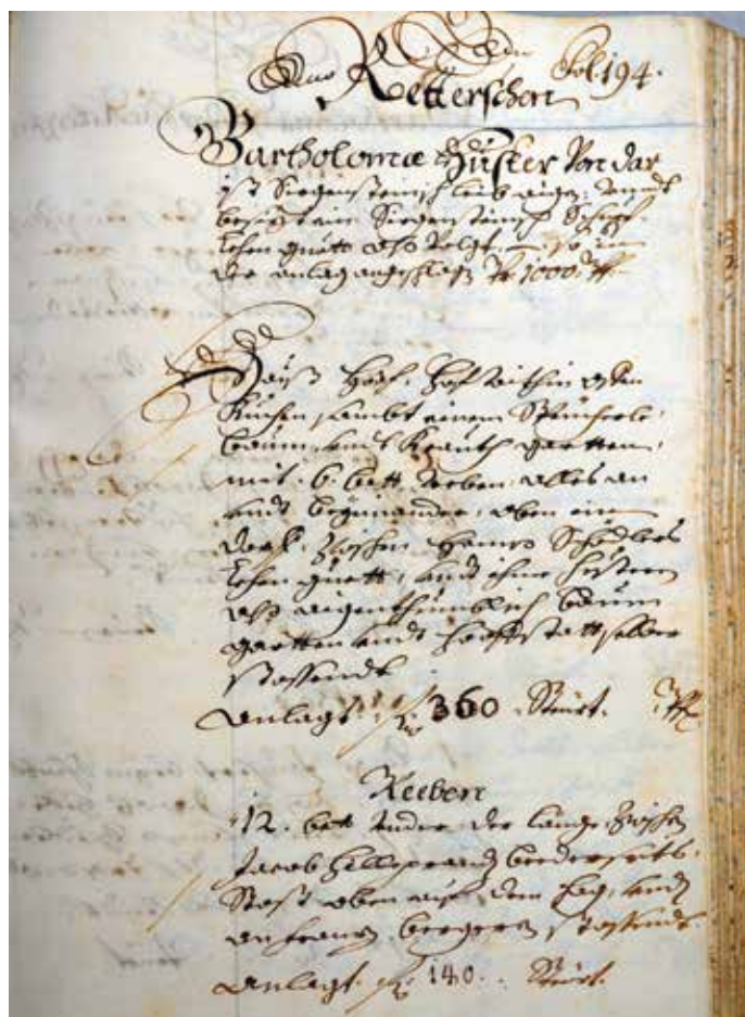
Eine frühe Beschreibung des Hofes findet sich in einer Art Grundbuch (Urbar) aus dem Jahr 1705 im Kressbronner Gemeindearchiv.

Sie erreichen uns telefonisch unter 07543-966260, Email unter buergerbus@kressbronn.de . Ruhezeiten gelten auch fürs Telefon.