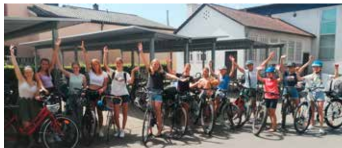
Das Team des Graf-Zeppelin-Gymnasiums Friedrichshafen führt mit 58.320 Radkilometern und 396 aktiven Radlerinnen und Radlern die Spitze aller Teams an und gewinnt in den Kategorien „beste Schule“ sowie „größtes und radelaktivstes Team“.

Bei der Aktion Stadtradeln 2022 haben im Bodenseekreis 278 Teams mit insgesamt 3.850 Radlerinnen und Radlern mitgemacht und zusammen 855.343 Kilometer zurückgelegt. „Das