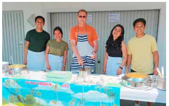
Die Helferinnen und Helfer des KTEP-Teams