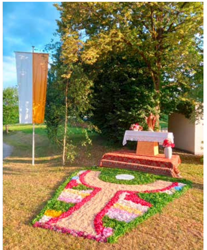
Eine der schön geschmückten Altarstationen