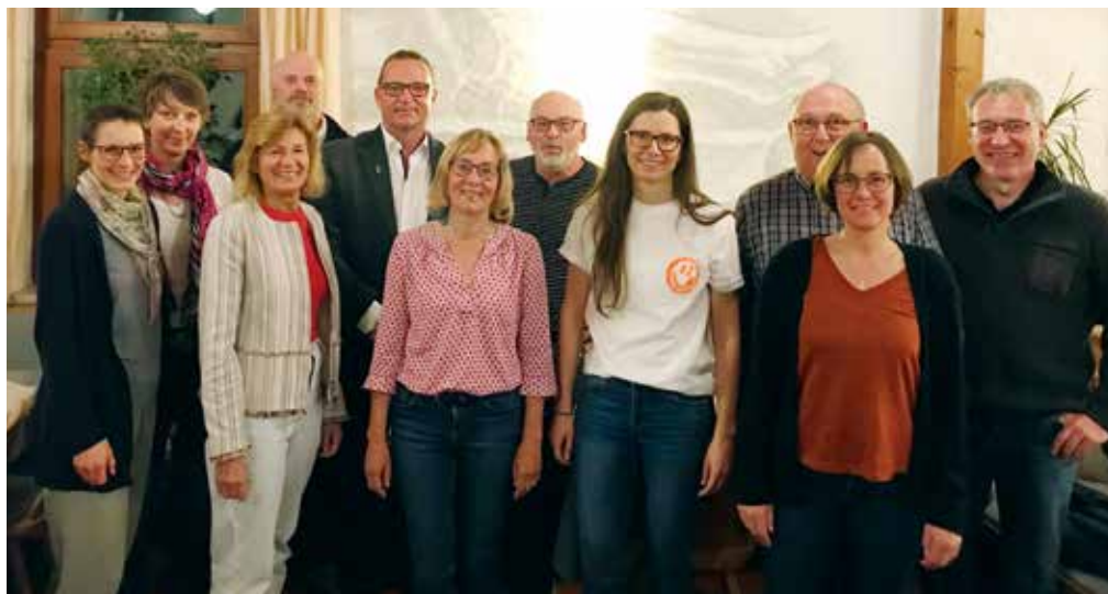
Die neue gewählte Vorstandschaft des TV Kressbronn von links: