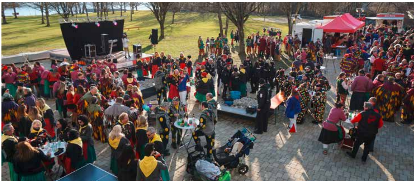
Ein schön bunter Anblick – Die Narren der Kressbronner, Langenargener und Nonnenhorner Zünfte.