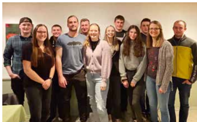
die neugewählte Vorstandschaft der Landjugend

Nach der JHV im Juni 2021 lernten wir unsere neuen Mitglieder bei einer Mostprobe besser kennen und planten den Tag der Technik in Oberdorf. Wir trafen uns zu gemütlichen Abenden im Rädle und Restaurants in Kressbronn. Im Oktober bereiteten unsere fleißigen Mädels wieder den Erntedankaltar vor, mit anschließendem Gottesdienst mit unserer neuen Landjugendtracht. Danach ging es schon wieder weiter mit den „Weihnachtsvorbereitungen“. Wir stellten wie jedes Jahr unsere Weihnachtskrippe am Rathausplatz auf und starteten die Vorbereitungen für den Weihnachtsmarkt, der leider doch ins Wasser fiel. Wir bedanken uns trotzdem bei allen, die uns unterstützt haben, und an den verschiedensten Orten unsere handgemachte Dekoration gekauft haben. Im neuen Jahr konnten wir wieder