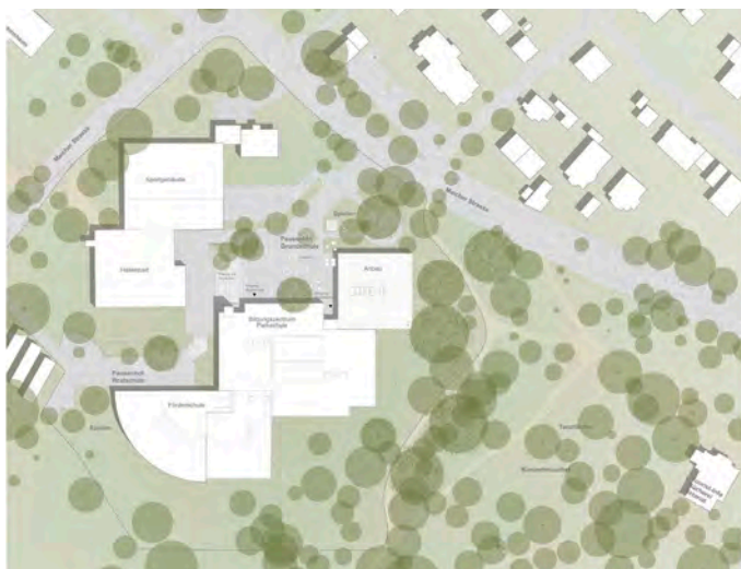
1. Preis (1017)