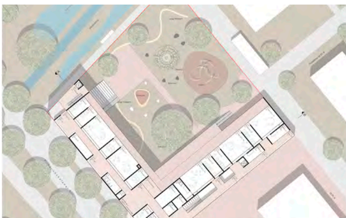
2. Preis (1011)

Die Gemeinde Kressbronn a. B. beabsichtigt im Jahr 2022/2023 im Baugebiet Bachtobel ein Familienzentrum zu errichten. Neben der fünfgruppigen Kinderbetreuungseinrichtung sollen im Objekt das Archiv, eine Tiefgarage sowie kommunale Wohnungen errichtet werden. Zur Realisierung dieses Objektes wurde ein Architektenwettbewerb ausgelobt. Am vergangenen Donnerstag hat das Preisgericht tagend und über die eingereichten Entwürfe der Architekten entschieden. Da keiner der Entwürfe die Kriterien vollumfänglich erfüllt hat, wurden drei zweite Plätze vergeben. Nun haben die Architekten die Möglichkeit, ihre Entwürfe nachzubessern. Das Preisgericht wird dann nochmals tagen. Die Gemeinde wird danach die Pläne der Preisträger veröffentlichen.