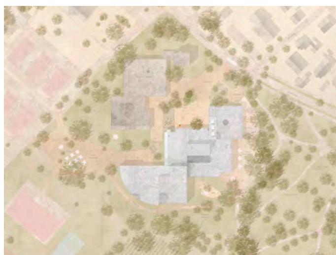
4. Preis (1018)