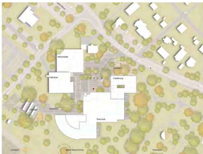
2. Preis (1009)