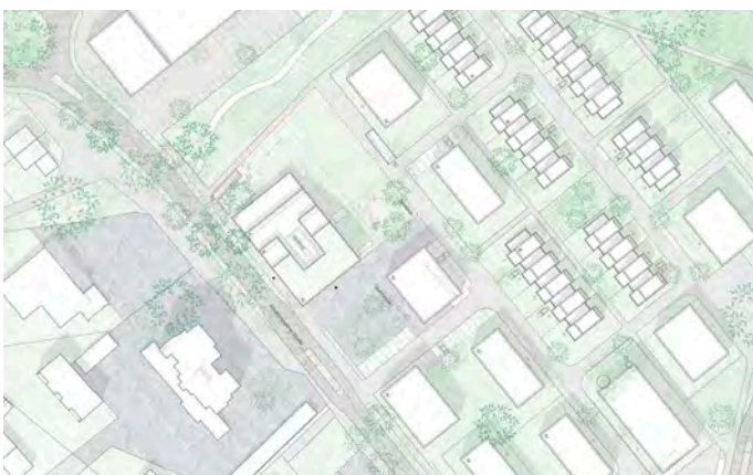
2. Preis (1014)