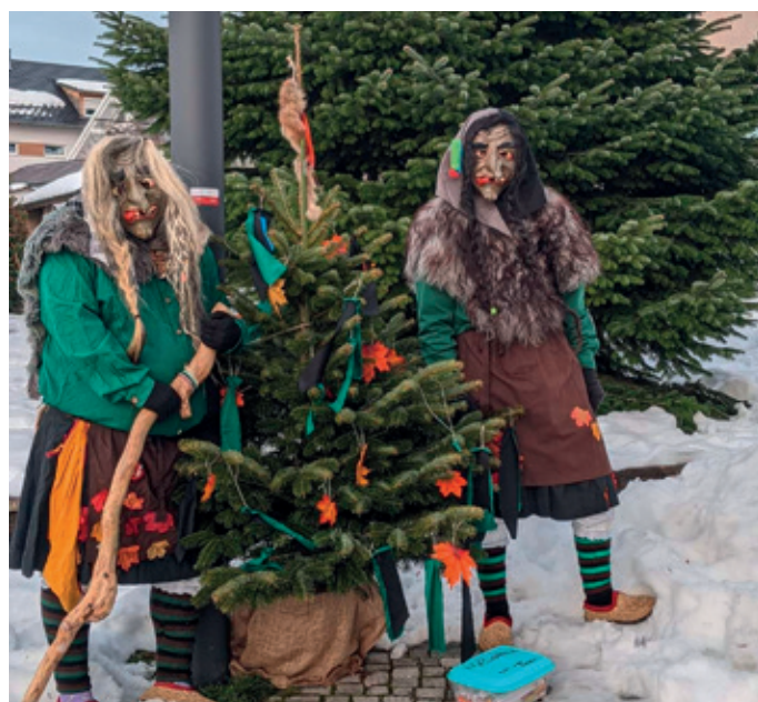
Mit Maske am Narrenbäumchen

Bilder von allen Narrenbäumchen sind auch auf der Instagramseite der Gemeinde Kressbronn a. B. zu finden (@kressbronnambodensee)