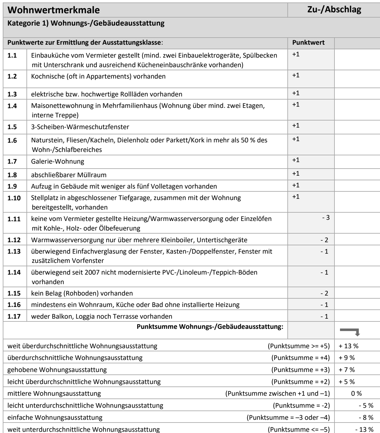
Tabelle 2: Weitere Wohnwertmerkmale, die den Mietpreis signifikant beeinflussen